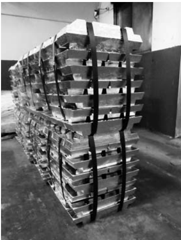
リサイクルされた再生インゴット

シリコンのリサイクルを主に手掛けている。14年に設立。本社は台南市内にあり、亜邦国際科技が100%出資する。台湾および中国大陸で各種特許を保有する。博士号や修士号を保有する社員が多く、新進鋭な技術者が集まっている。近年では太陽光発電パネルのリサイクルなどにも注力している。