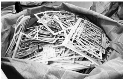
IT関連企業から発生するEスクラップ

台湾は世界的なIT産業の集積地であり、TSMCなど世界的な半導体メーカーが顔をそろえる。それらの企業から発生する使用済みの端材や廃棄物を処理するリサイクル企業も数多く存在しており、技術力も世界トップレベルにある。2015年以降、産業新聞社では台湾のリサイクル企業への取材に注力してきた。今回の特集では取材実績のある現地の有力リサイクラーを紹介する。日台のリサイクル分野における交流の一助として頂ければ幸いだ。なお、掲載している情報は取材当時のもので、現在の詳細については各企業に「連絡ください」。