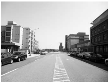
桃園科学技術環境保護パーク

工場は台湾国内に複数あり、主力工場が15万3000平方メートルで、台南市北部に位置する。工場は台湾国内に複数あり、主力工場が15万3000平方メートルで、台南市北部に位置する。